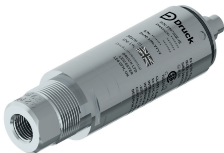
PM700E (manométrico, absoluto)