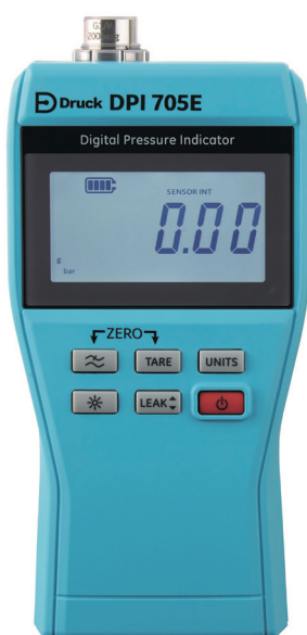
Indicador de presión para zonas seguras