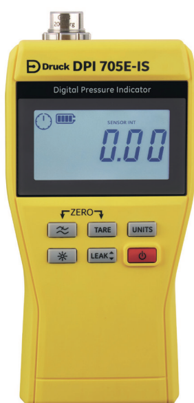
Indicador de presión para zonas peligrosas

La serie Druck DPI 705E de indicadores portátiles de presión y temperatura opcional combina un diseño robusto con mediciones precisas y fiables.